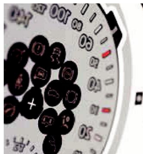
In the fast lane with the highest efficiency and quality printed with SEFAR® PME 110/280-35Y