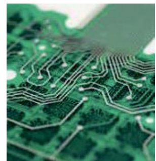
Functional layers and conductive paths in highest quality printed with SEFAR® PME 130/330-30Y