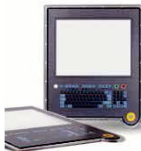
Clear and durable signs and inscriptions printed with SEFAR® PME 150/380-30Y