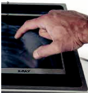
Whether edge masking or protective coatings printed with SEFAR® PME 140/355-30Y

SEFAR® PME has proven unbeatable, especially when going to the limits of what is possible in screen printing, particularly in the industrial production of printed electronic components and functional coatings as well as in all other applications that require highest screen printing performance.